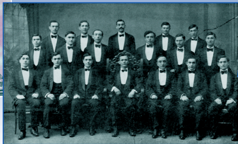
Les pères fondateurs - 1907